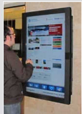
Pantalla interactiva interior