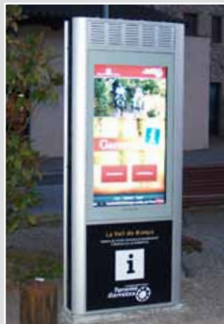
Tòtem interactiu exterior